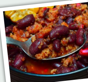
Chili Sin Carne

Délai de commande client mini : A pour C. Sur stock.