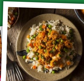
Curry de Soja